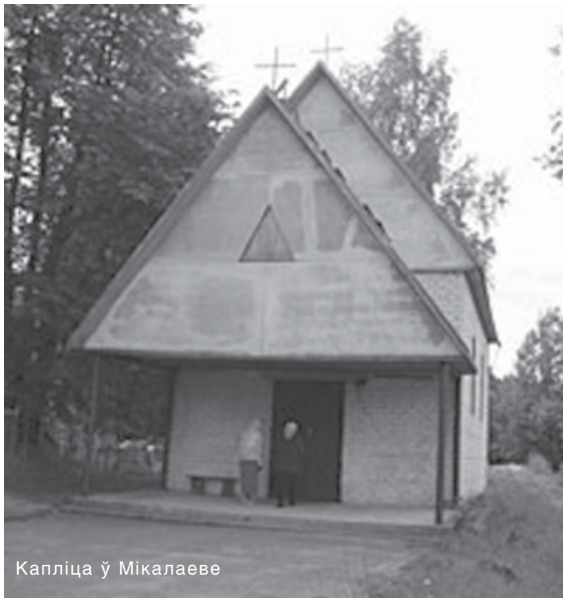
Капліца ў Мікалаеве

Выданне культурна-асветніцкага цэнтра імя Язэпа Драздовіча і Шаркоўшчынскай раённай арганізацыі ГА "Таварыства беларускай мовы імя Францыска Скарыны"