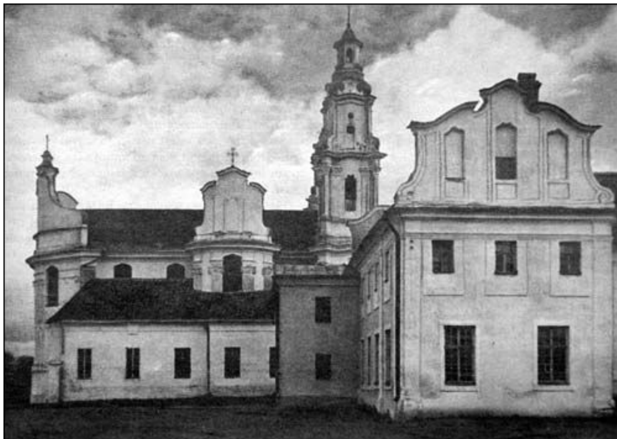
Бакавы фасад. 1930-х гг. У хуткім часе бальшавікі зробіць тут турму.

35. Глазко Міхал, 21 год, фальварак Латышы, Луж-