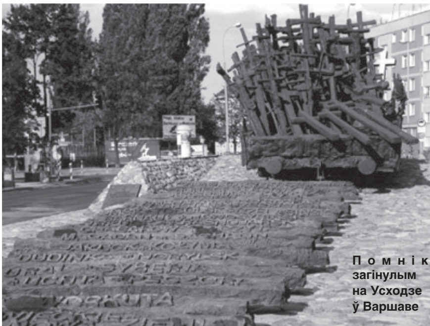
Помнік загінулым на Усходзе ў Варшаве